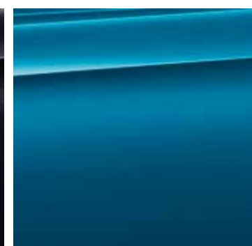
Métallisée Long Beach Blue