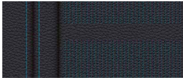
□ Cuir Dakota "Schwarz/Blau" perforé 1