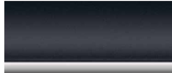
■ Inserts décoratifs brillants "Schwarz" soulignés de chrome perlé