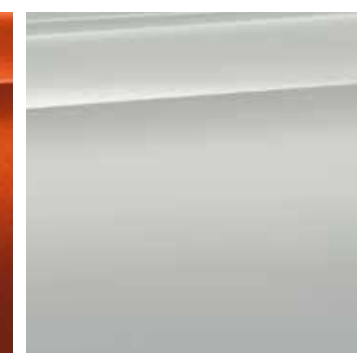
Métallisée Hockenheim Silber