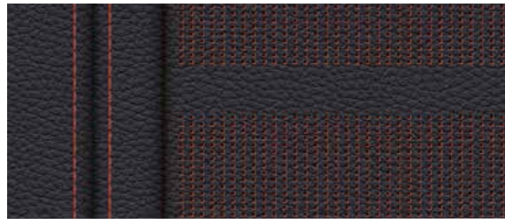
□ Cuir Dakota "Schwarz/Orange" perforé 1