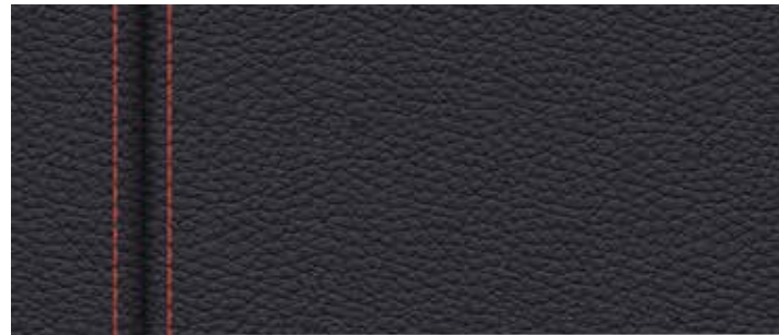
■ Cuir Dakota "Schwarz" avec surpiqûres contrastantes orange