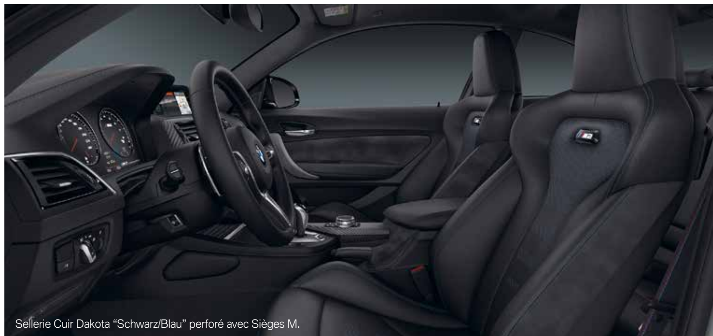
Sellerie Cuir Dakota "Schwarz/Blau" perforé avec Sièges M.