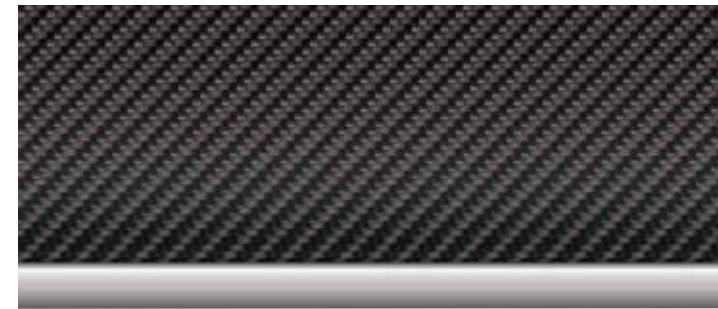
□ Inserts décoratifs en fibre de carbone soulignés de chrome perlé