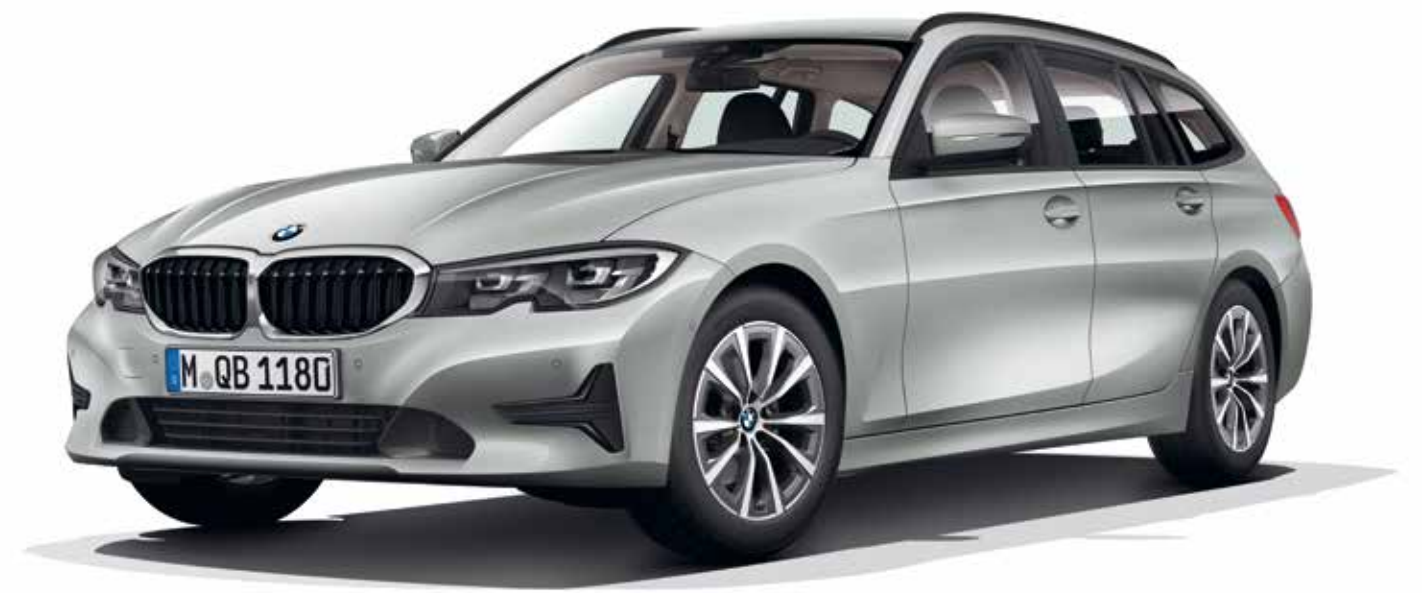
BMW 320d Touring Lounge dans la teinte de carrosserie Glaciersilber présentée avec les jantes alliage 17 style 775