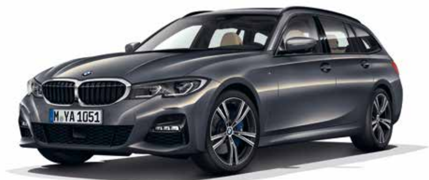
Présentée avec équipements optionnels